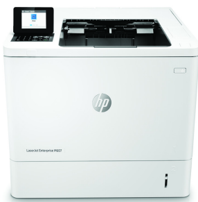
HP LaserJet Enterprise M607n

Dieser HP LaserJet Drucker mit JetIntelligence kombiniert herausragende Leistung und Energieeffizienz mit Dokumenten in professioneller Qualität zum richtigen Zeitpunkt – Ihr Netzwerk bleibt dabei durch die branchenweit umfassendsten Sicherheitsfunktionen geschützt 1