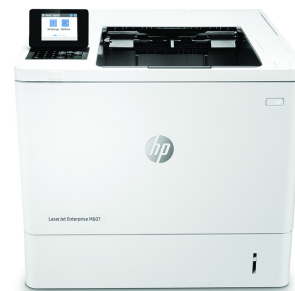
HP LaserJet Enterprise M607dn

Dynamic-Security-fähiger Drucker. Ausschließlich für die Verwendung mit Patronen mit Original HP Chip vorgesehen. Patronen mit Chips anderer Hersteller funktionieren möglicherweise nicht oder in Zukunft nicht mehr. Weitere Informationen unter: