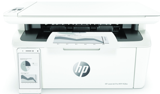
HP LaserJet Pro MFP M28w Drucker

Dynamic-Security-fähiger Drucker. Ausschließlich für die Verwendung mit Patronen mit Original HP Chip vorgesehen. Patronen mit Chips anderer Hersteller funktionieren möglicherweise nicht oder in Zukunft nicht mehr. Weitere Informationen unter: