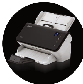
Kodak E1025 und E1035 Scanner

* Die Durchsatzgeschwindigkeit ist von der Anwendungssoftware, vom Betriebssystem, vom Computer und von den ausgewählten Bildverarbeitungsfunktionen abhängig.