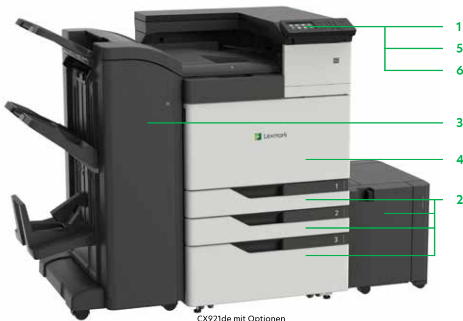
CX921de mit Optionen

Drucken Sie Microsoft Office-Dateien, PDFs und andere Dokument- und Bildarten von Flash-Laufwerken, oder wählen Sie Dokumente auf Netzwerk-Servern oder Online-Laufwerken aus und drucken Sie sie.